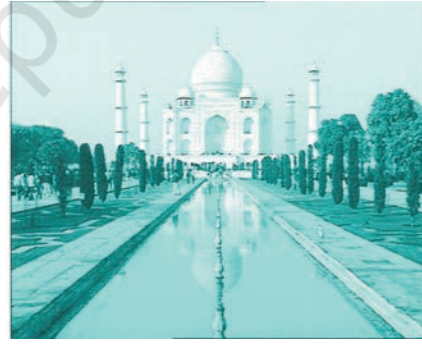
تاج محل (یوپی)